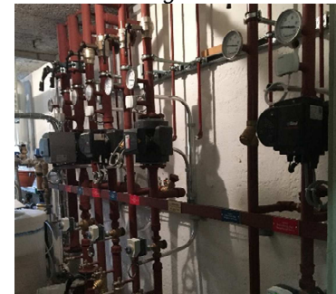
Wärmeverteilung nach der Sanierung