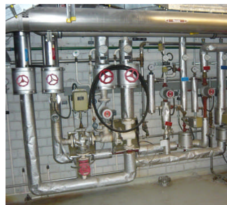
Sanierungsbedürftige Heizungsunterstation ARA Ergolz 2